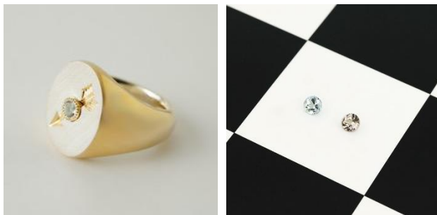
リング（シルバー/ゴールドコーティング/アクアマリン） ¥ 56,100