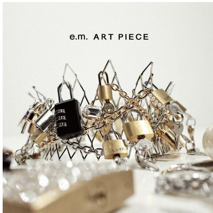
デザイナーが25周年の節目に制作したアートピース