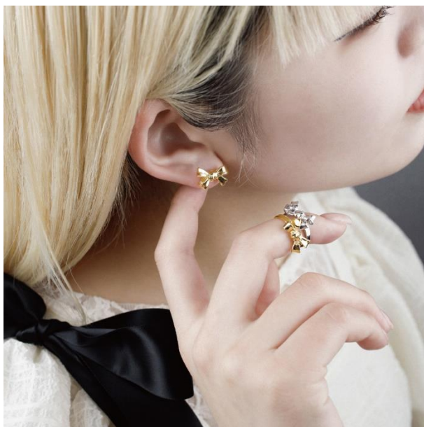
ピアス ¥4,400 ピンキーリング 各 ¥5,500 (すべて税込)