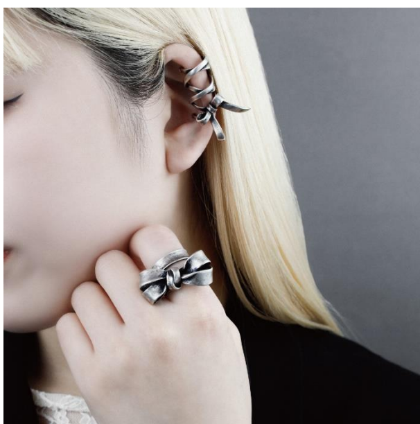
イヤークフ ¥18,700 リング ¥18,700 (すべて税込)